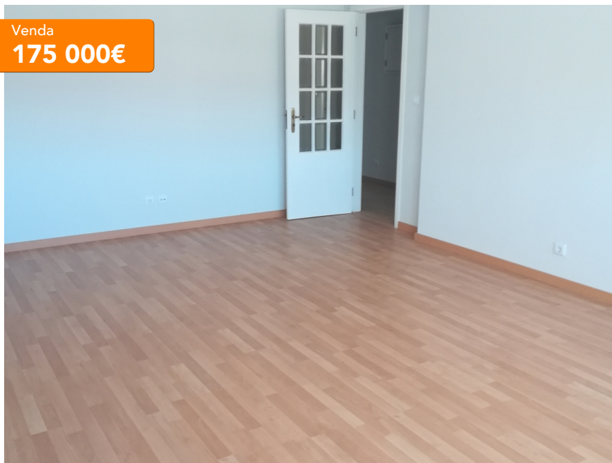
Apartamento T3 Excelente Remodelação